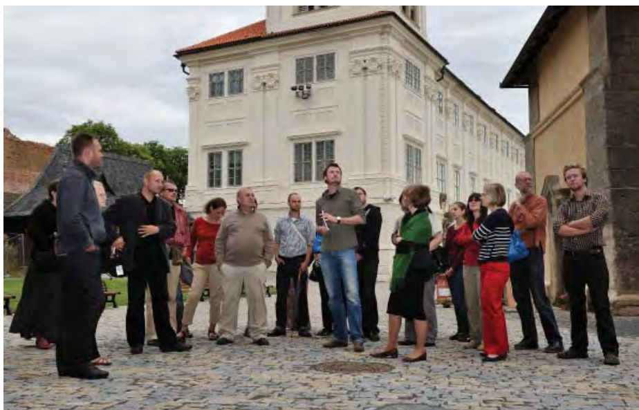
Účastníci semináře před Jezuitskou kolejí a v lapidáriu chrámu svaté Barbory v Kutné Hoře.