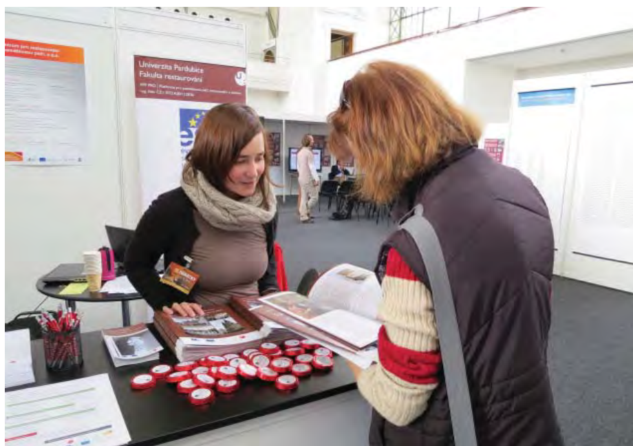
Výstavní stánek projektu „Platforma pro památkovou péči, restaurování a obnovu“ si na nezáměrně vysokém návštěvníkovi nemohl stěžovat.

Nezbývá, než konstatovat, že prezentace projektu „Platforma pro památkovou péči, restaurování a obnovu“ na veletrhu bohatě naplnila očekávání.