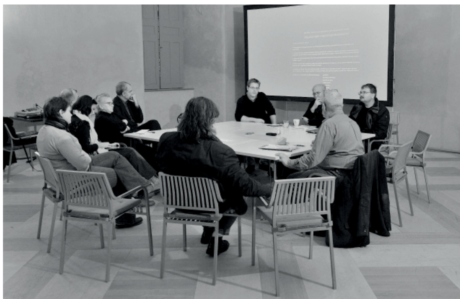
Dějištěm 5. panelové diskuse, vůbec poslední akce projektu PPP PRO určené pro širokou veřejnost, se opět staly prostory Galerie Středočeského kraje v Kutné Hoře.

užívané v oboru péče o kulturní dědictví, jak se na jejich významu shodly partnerské instituce zapojené do projektu. Stručnou definici vždy doprovází podrobnější vysvětlení jejich problematičnosti. Zejména stručné úvodní definice pojmů však představují shrnutí mezioborově přijatelných významů vybraných termínů, které snad aspoň v malé míře přispěje k ujasnění situace v prostředí lexikální praxe památkové péče.