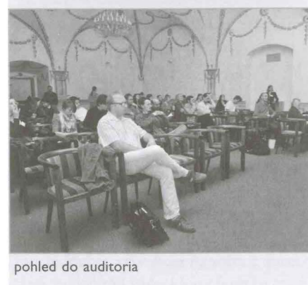
pohled do auditoria

Reprezentativní prostory kongresového centra zámku v Litomyšli hostily ve dnech 26. – 27. dubna konferenci s názvem „Interdisciplinarita v péči o kulturní dědictví.“ Akce poskytla prostor k setkání několika desítek odborníků z různých oblastí péče o kulturní dědictví a představovala tak úspěšné vyvrcholení první části projektu Platforma pro památkovou péči, restaurování a obnovu.