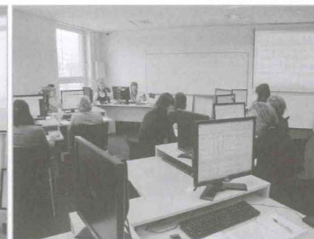
kurz Interní informační systémy pro finanční manažery evropských projektů